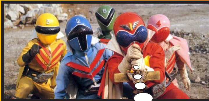
Les Go Rangers en action !

Leur costume est très important car c'est ce qui leur donne leur pouvoir, et c'est sa couleur qui les différencie. Ils jonglent généralement entre les combats à terre et les combats avec des robots. La première série de Super Sentai sortie au Japon en 1975 s'intitulait "Go Rangers"; et en France, c'est en 1985 avec "Biomon" que ce genre se fit connaître. Depuis une saison de Super Sentai est produite chaque année au Japon.