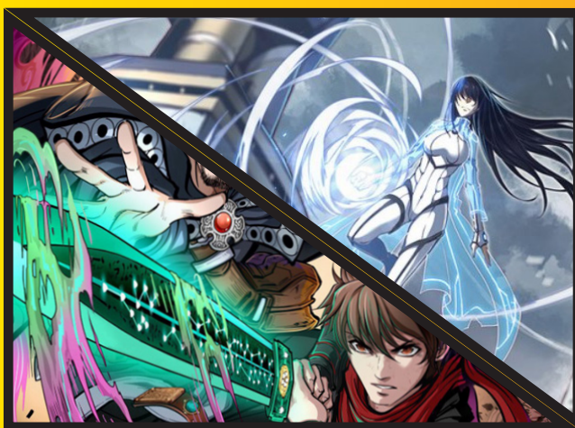
Aero et Lin Lie

Ici, c'est un cas assez particulier. Les chinois sont des gros consommateurs de blockbuster américain et en particulier de films de super-héros. À tel point que ces films sont souvent premiers au box office chinois. Par exemple, le film "Captain Marvel" sorti cette semaine là bas, réalise un gros démarrage et rapporte 85,1M$ pour son premier week-end d'exploitation. Il fait donc la plus grosse recette de la semaine, 60M$ devant le deuxième film. Pourtant, malgré qu'ils en soient friands, la Chine ne crée pas de super-héros.